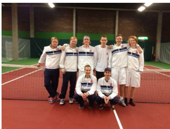
Serie, serie, seriesegrare..