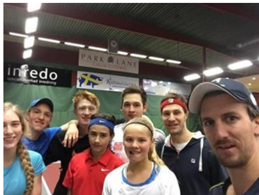
Inga fler "selfies" - Tillsammans är vi starka

Final Tennis Europé Göteborg singel Final Tennis Europé Göteborg dubbel Kvartfinal Hörsholm ITF Grade 4 Singel