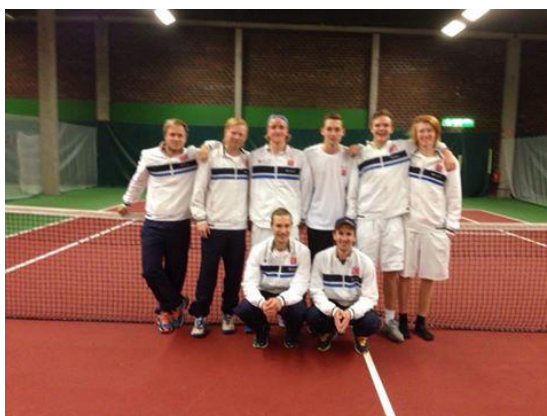
Serie, serie, seriesegrare..