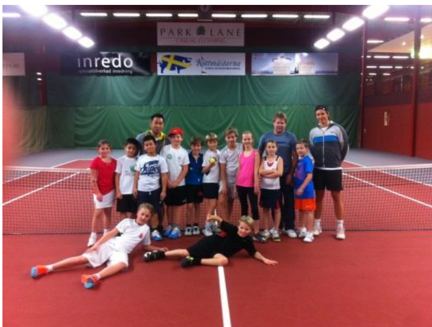
Några spelare och föräldrar som förhoppningsvis finns med i HTKs framtid

Föreningens stora utmaningar ligger i ekonomin. Under en fem-sexårsperiod har stora omställningar i föreningen och dess ekonomin gjorts och om man bortser från "gamla synder" gör HTK i stort ett nollresultat under dessa år. HTKs förhoppning är att under de närmsta åren nå ett litet överskott för att "komma ikapp" men då krävs att hela föreningen hjälps åt. Det främsta är att hjälpas åt att nyrekrytera nya kursdeltagare och få fler att spela tennis i Helsingborg och hos oss i HTK. Under 2015 kommer föreningen som del i denna målsättning satsa mer på de som inte tävlings spelare. Dock ska den höga kvalitet som finns för våra tävlings spelare bibehållas.