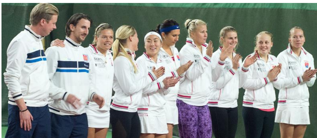
SM silver inomhus 2014