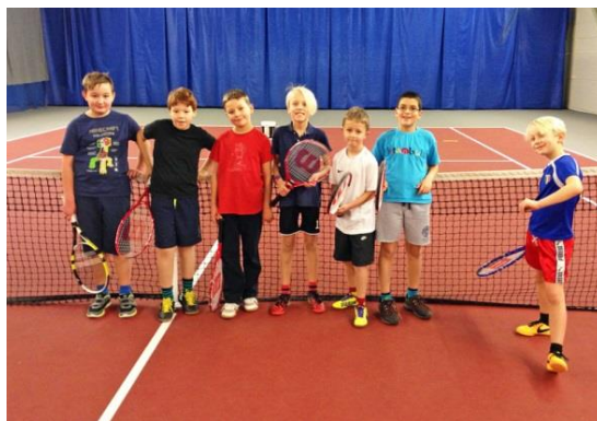
Några av våra sköna linare i HTK Klicka på bilden för mer info